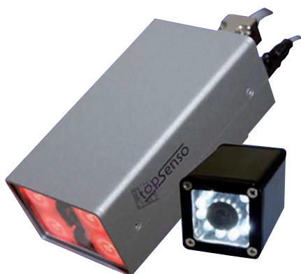
Sie lesen und verstehen die Codes der Postverarbeitung: Hochleistungssensoren von TopSenso

ren, aussteuern, Rückmeldungen an Druckersoftware geben und anderes mehr. Mit Hilfe der Anschlussbox kann man bis zu drei Topcams vernetzt arbeiten lassen, zum Beispiel für Vergleichslesungen, bei der Zusammenführung personalisierter Beilagen und Dokumente oder der Prüfung der Seitenabfolge, auch bei Duplexdruck.